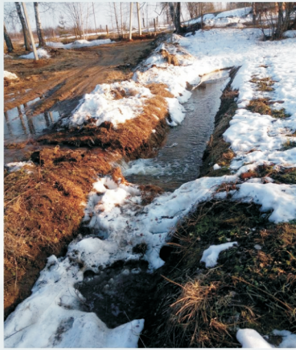
Пос.Кустово, жители прочистили водоотводную канаву и установили вазоны